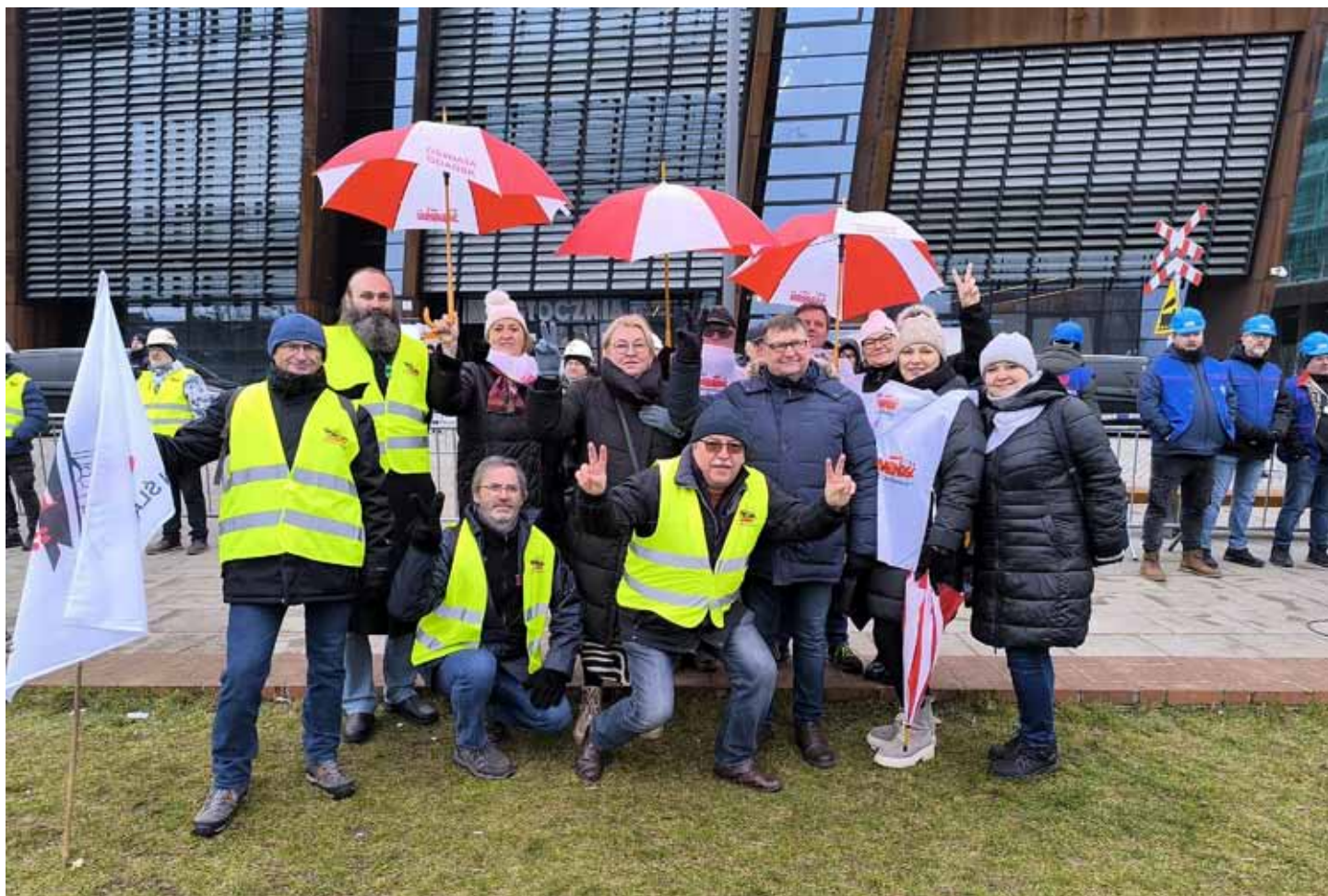
Grupa oświatowa wśród uczestników manifestacji styczniowej w Gdańsku przeciwko polityce Zielonego Ładu.