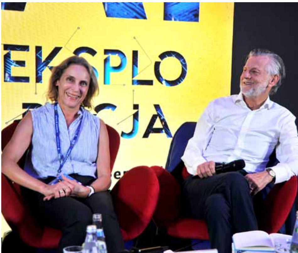
Autorzy książki na spotkaniu autorskim w Karpaczu.

Rewolucja cyfrowa zabrała nam prywatność. Teraz nic już nie jest takie jak wcześniej. Anonimowa technologia, której jeste-